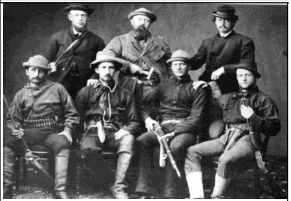
Les Rangers poursuivent les Comanches sur le Brazos